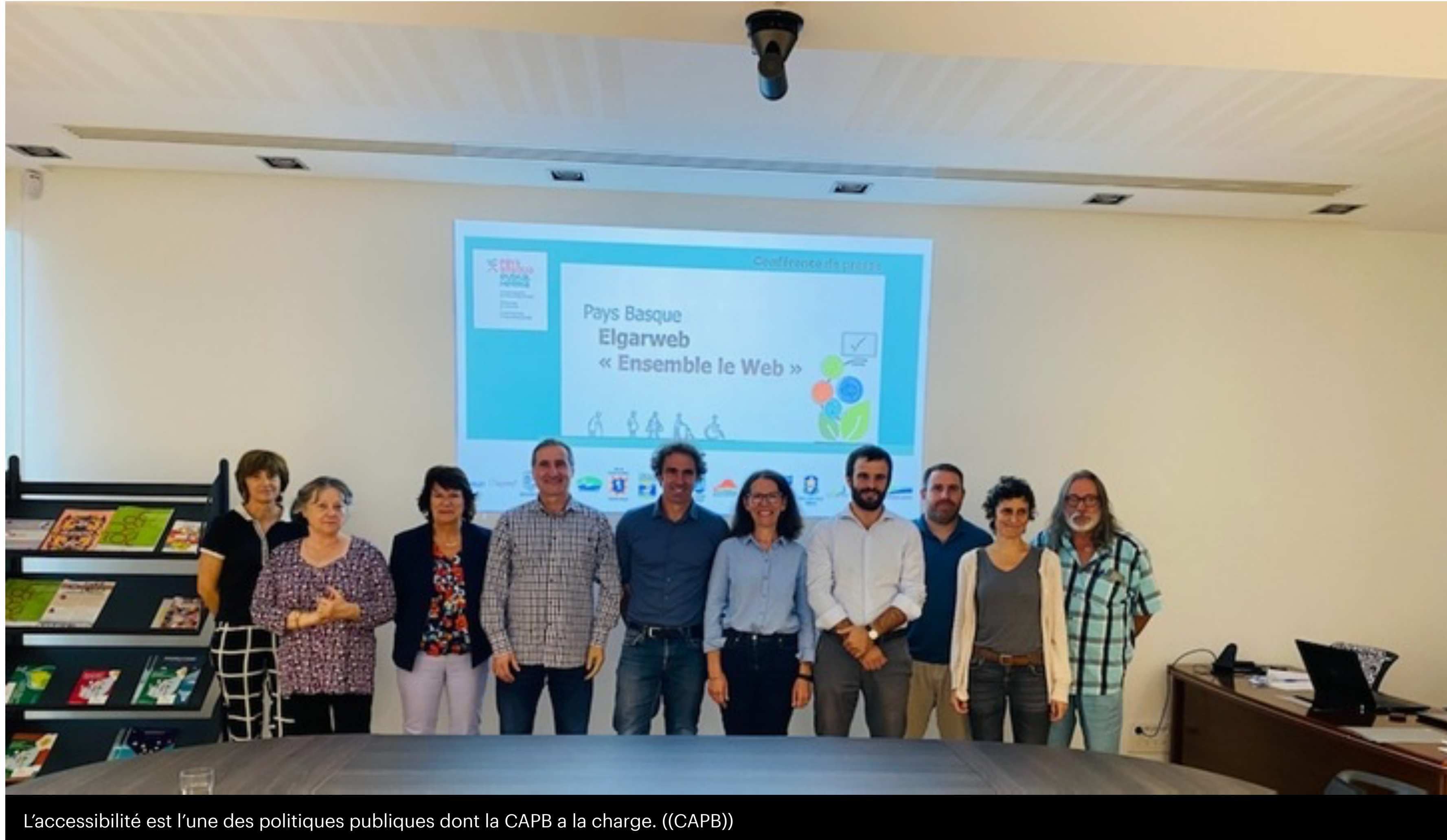
L'accessibilité est l'une des politiques publiques dont la CAPB a la charge. ((CAPB))

Face à une page web, nous ne sommes pas tous égaux. Difficile en tant que personne valide d'imaginer l'épreuve que représente la navigation sur Internet pour les personnes âgées ou handicapées, lorsqu'un site est surchargé d'informations ou tout simplement inaccessible à la lecture, faute d'un codage numérique adapté. C'est à ce double défi de l'accessibilité numérique et de l'écoconception que répond le dispositif Elgarweb (« Ensemble le web » en français), présenté le vendredi 21 octobre à la Maison de la Communauté du Pôle territorial Sud Pays Basque, à Urrugne.